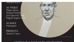
PABLO PARRILLA - La tierra de Joaquín el de la Paula homenajea a la Fundación Cruzcampo