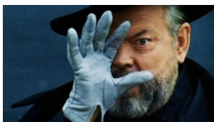
REDACCIÓN - Fundación Cajasol homenajea a Orson Welles