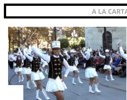
Así fue el desfile de bandas en 2013