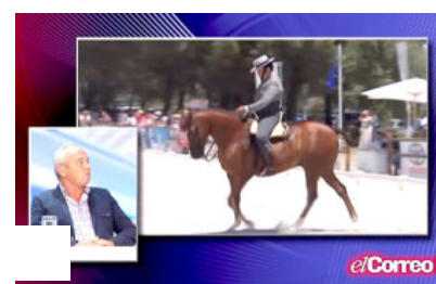
Arrear y Templar (29/10/15)